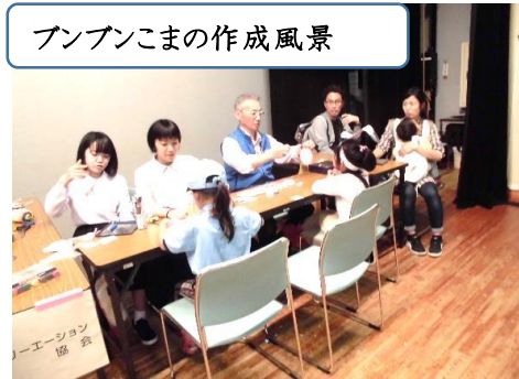
ブンブンこまの作成風景